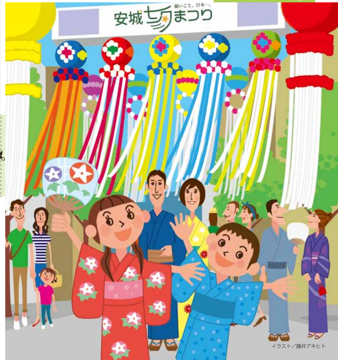
イラスト/藤井アキヒト